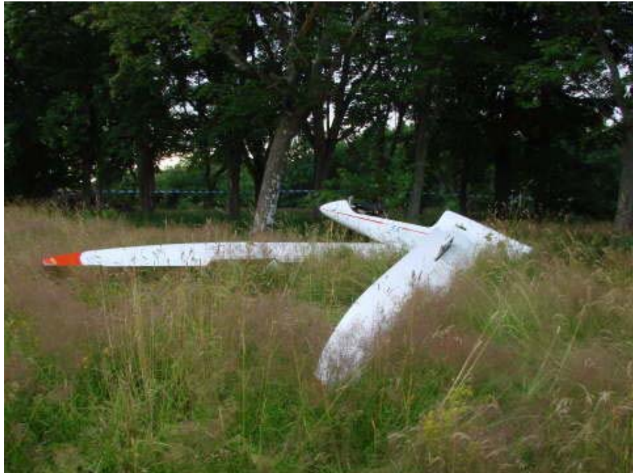
Bild 2 SE-ULL efter haveriet