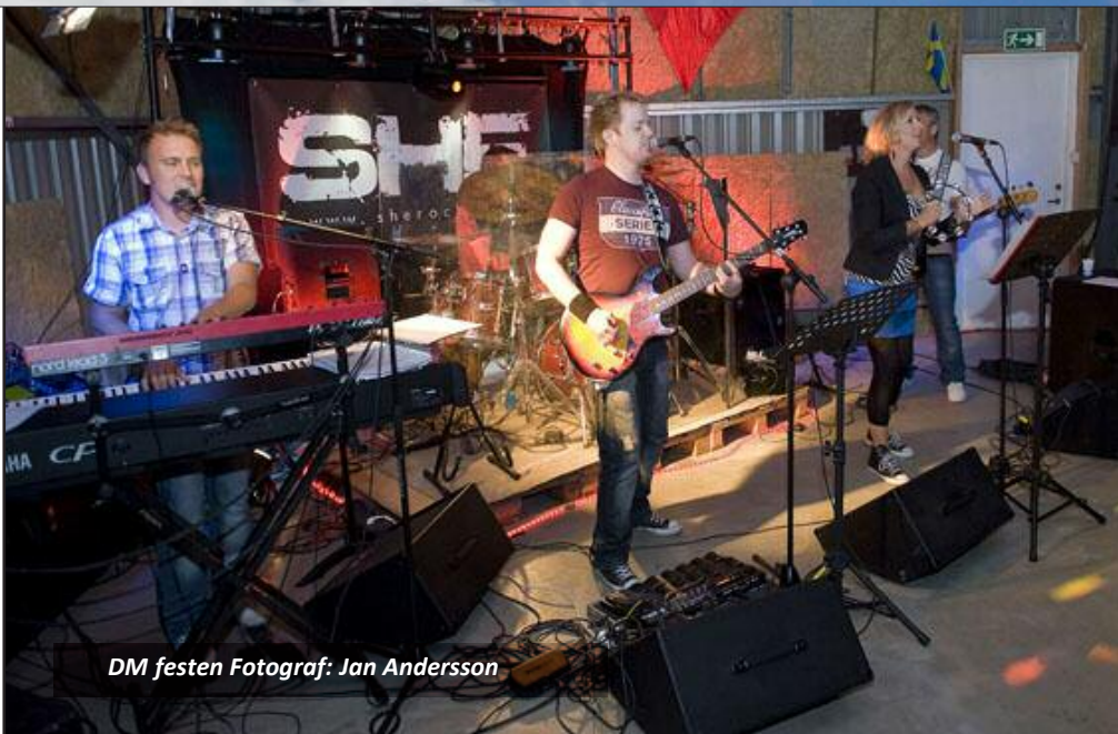
DM festen